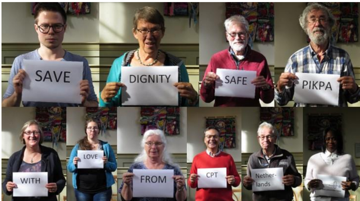
Deelnemers aan de heidag doen gezamenlijk mee aan een van de CPT-acties.

Om mensen toch te kunnen bereiken zijn we gebruik blijven maken van de digitale middelen die we al tot onze beschikking hadden, de website, nieuwsbrief, facebook, twitter en vredesnieuws. In 2020 hebben we daar nog Instagram aan toegevoegd. De nieuwsbrief is iedere maand uitgekomen en de daarmee gemoeide tijd hebben we vanaf februari aanzienlijk gereduceerd door het vertaalwerk uit te besteden. Nieuw in de nieuwsbrief zijn de oproepen tot actie, waarmee lezers eenvoudig zelf deel kunnen nemen aan acties die onze programma's ondersteunen.