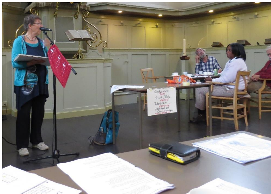
Veel om over te praten tijdens de heidag

Het doel om ons bereik structureel te vergroten in 2020 is niet geslaagd. Wel vermoeden we dat het zonder corona een realistisch doel was. Het aantal nieuwsbriefabonnees is na 1 bijeenkomst in februari 2020 gestegen van 100 naar 138, wat ons optimistisch maakt dat dit met meer evenementen die inschrijfmogelijkheden bieden wel gehaald kan worden. Ook het aantal volgers op facebook is gestegen (naar 357) en op Instagram hebben we 81 volgers.